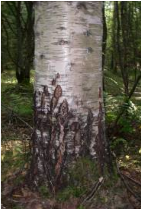
Rauduskoivun runko, vanha.