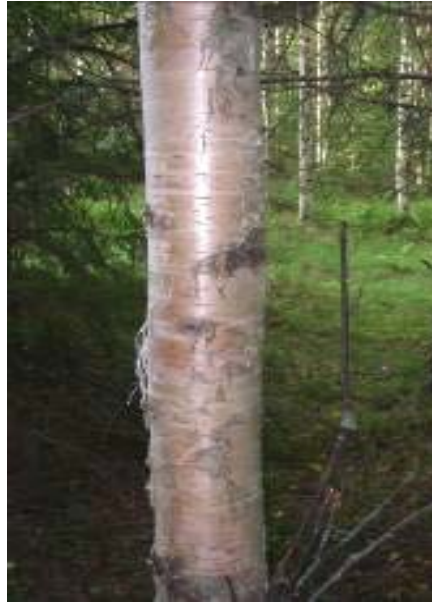
Hieskoivun runko, nuori.