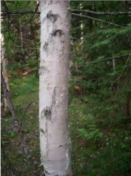
Rauduskoivun runko, nuori.