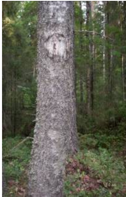
Hieskoivun runko, vanha.