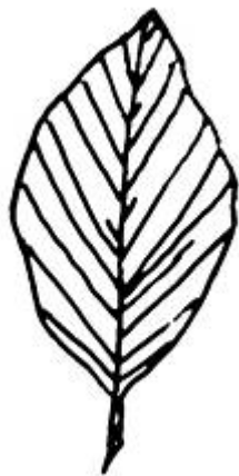
Piirroskuvat: © Tarja Ryhänen